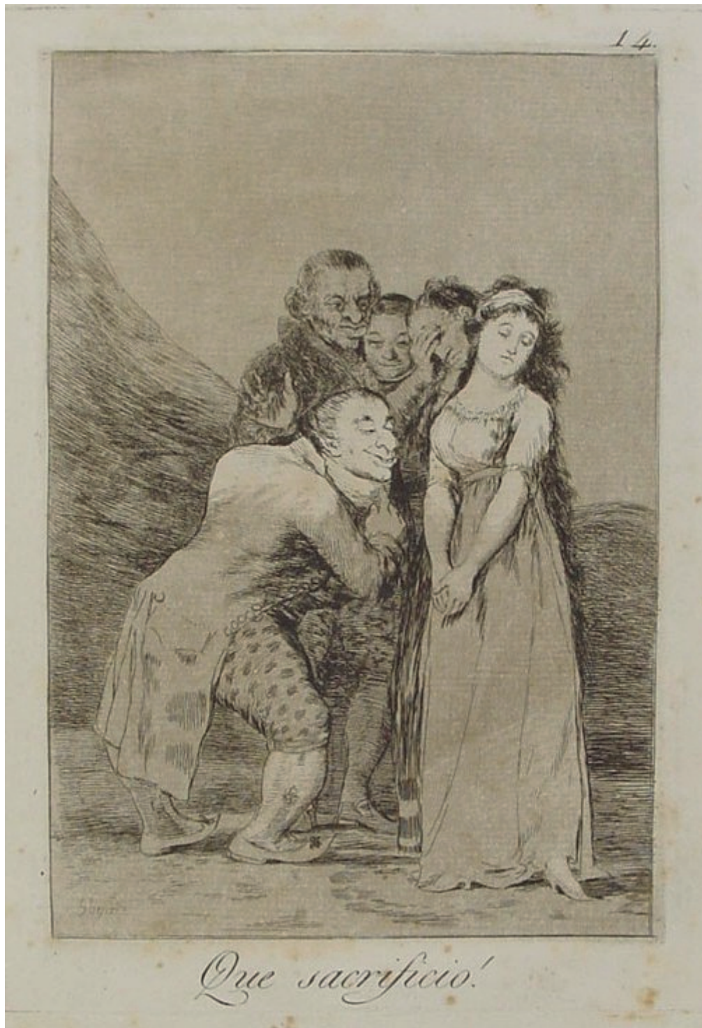
Francisco DE GOYA, ¡Qué sacrificio! , grabado de la serie Los Caprichos , 1799

la joroba: la bosse el jorobado: le bossu