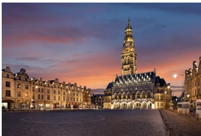
L'Escape Game du Beffroi d'Arras sur TF1

Le beffroi d'Arras est devenu depuis 2018 le théâtre d'un Escape Game in situ dans lequel il faut venir résoudre un mystère en trouvant des indices et en dénouant différentes énigmes. La ville d'Arras souhaite ainsi populariser son patrimoine à travers une découverte ludique de son monument le plus emblématique.