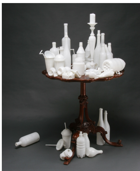
Matt Eskuche, 29 hours of television , 2008.