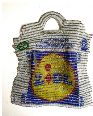
Shige Fujishiro, LIDL , 2010.