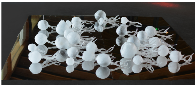
Le 7ème continent , 2018, Cristal.