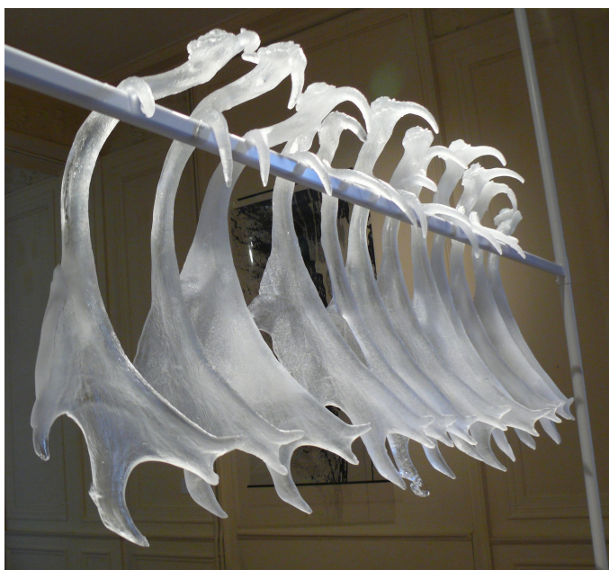
Bois en souffrance , 2011, cristal.