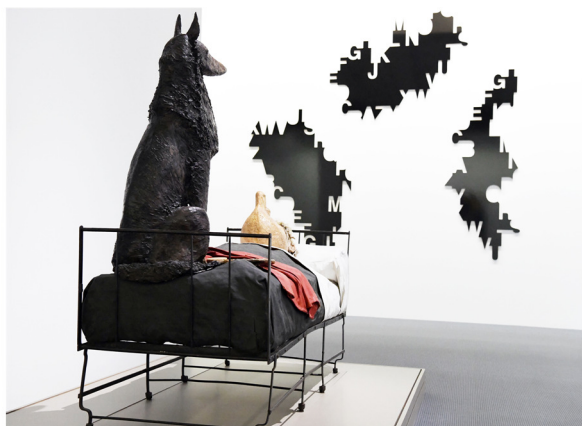
Vue de l'exposition, Jean-Jules Chasse-Pot, Le Petit chaperon rouge en grève , 1971, Étienne Pressager, Les Iles alphabétiques , 2007, collection LAAC, Dunkerque © Adagp, Paris, 2023.

L'accrochage « Lettres, signes, écritures » propose un nouveau parcours des collections centré sur le sujet des relations entre art et écriture, à partir d'une sélection d'œuvres de la collection du LAAC, pour la plupart sorties des réserves.