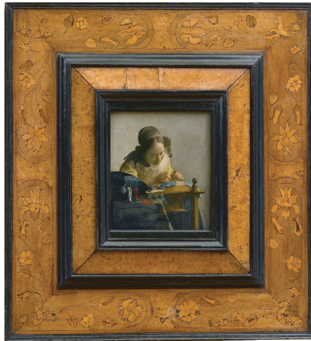
Johannes Vermeer, La Dentellière, vers 1669-1670, huile sur toile, Paris, Musée du Louvre, cadre d'origine

Les élèves en circulant dans les espaces aménagés de la Galerie du temps pourront se rendre compte au contraire que les tableaux situés à proximité de La Dentellière obligent le corps à l'éloignement dans un mouvement de recul pour une observation accrue de la scène représentée.