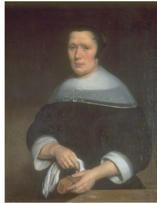
Nicolas Maes, Portrait de femme, 1667, huile sur toile, Arras, Musée des Beaux-Arts

Activité 3 – Amener les élèves à percevoir la singularité de l'organisation spatiale dans La Dentellière de Johannes Vermeer.