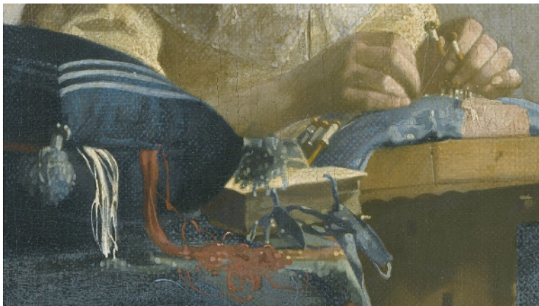
Johannes Vermeer, La Dentellière (détail), vers 1669-1670, huile sur toile, Paris, Musée du Louvre

Les élèves se livrent à une analyse des lignes de contour des objets et des lignes des principales figures dans les deux œuvres. Ces femmes réalisent des gestes ou des activités du quotidien dans ce que l'on suppose être un intérieur bourgeois et dans des postures qui relèvent d'un moment privilégié (dentelle au fuseau pour la première, lecture des textes sacrés pour la seconde), le tout dans un cadrage resserré. Des contradictions apparaissent cependant à mesure que l'on se rapproche de la scène. Chez Vermeer, des éléments représentés se brouillent par endroit. Les minces fils tendus qui pourraient donner forme au motif de cette pièce de dentelle sont bien visibles mais les mains et le coussin bleu sur lequel l'ouvrage se réalise paraissent flous. Les peintres du 17 e siècle utilisaient parfois la chambre noire pour l'apprentissage du métier mais ce moyen particulier de représentation comporte quelques désagréments : certaines zones excentrées paraissent imprécises ou brouillées. Vermeer s'est servi avec malice des effets produits par l'utilisation de cet instrument avec une logique particulière qui échappe néanmoins aux plus grands experts.