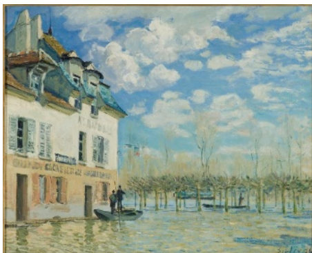
Alfred Sisley La barque pendant l'inondation, Port-Marly, 1876 Huile sur toile, H. 50,4 ; L. 61,0 cm Musée d'Orsay, Legs comte Isaac de Camondo, 1911