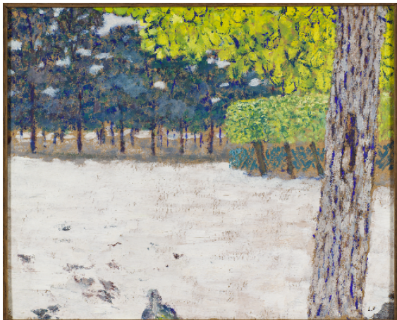
Edouard Vuillard Le Jardin des Tuileries, vers 1894-1895 Huile sur carton H. 28,0 ; L. 33,8 cm Musée d'Orsay, Donation sous réserve d'usufruit, 2010