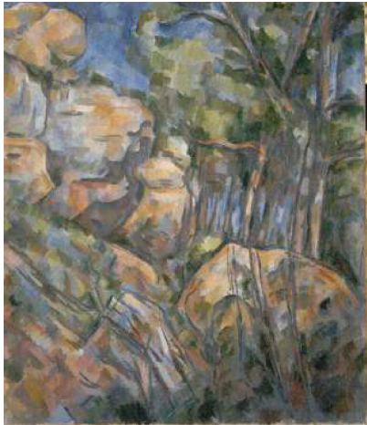
Paul Cézanne, Rochers près des grottes au-dessus de Château-Noir , vers 1904 Huile sur toile, H.65,5 ; L. 54,5 cm Musée d'Orsay Dation, 1978