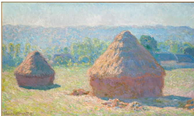
Claude Monet Meules, fin de l'été, 1891 Huile sur toile, H. 60,5 ; L. 100,8 cm Musée d'Orsay, Achat sur les fonds d'une donation anonyme canadienne, 1975