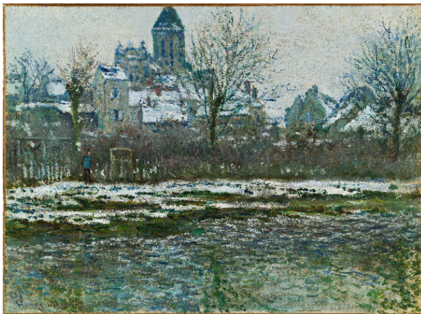
Claude Monet Effet de neige à Vétheuil , entre 1878 et 1879 Huile sur toile, H. 52,5 ; L. 71,0 cm Musée d'Orsay, Legs Gustave Caillebotte, 1894