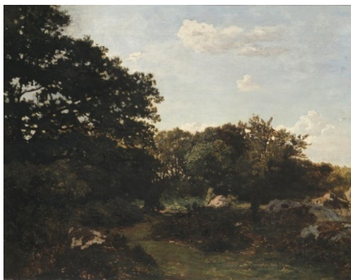
Frédéric Bazille Forêt de Fontainebleau , 1865 Huile sur toile, H. 60,0 ; L. 73,2 cm. Musée d'Orsay, Don Mme Fantin-Latour, 1905