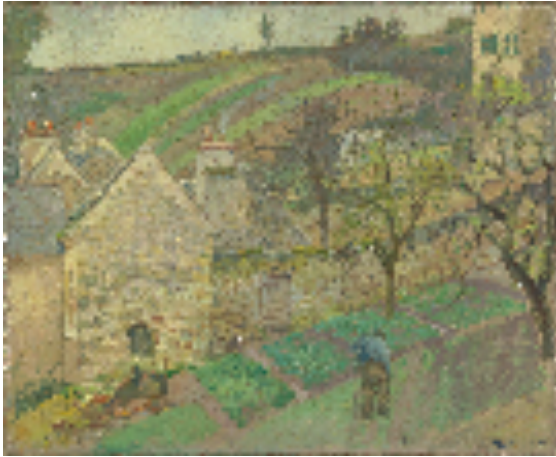
Camille Pissarro Coteau de l'Hermitage , Pontoise, 1873 Huile sur toile, H. 60,0 ; L. 73,0 cm Musée d'Orsay, Dation, 1983