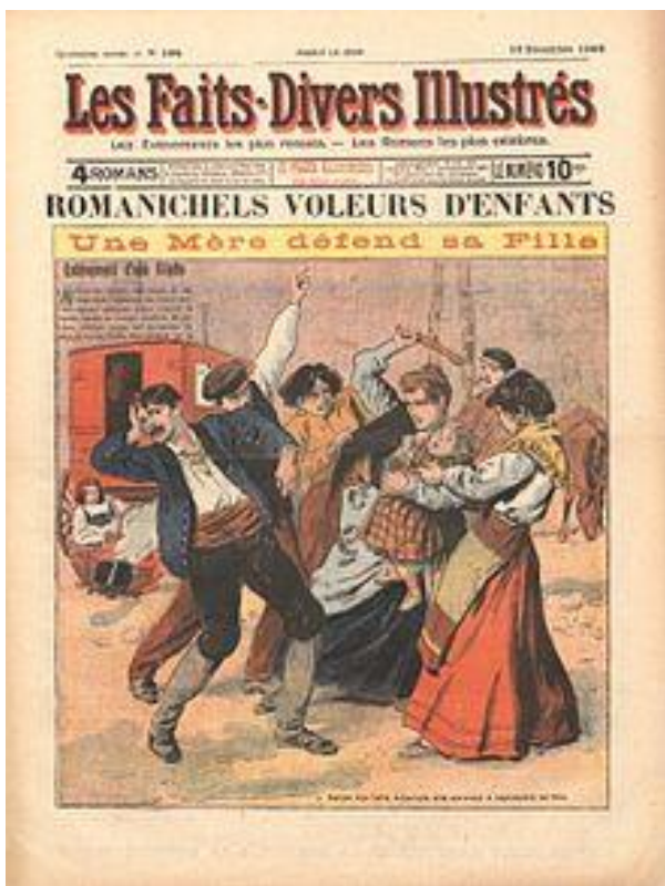
« Une », Les faits divers illustrés , 10 décembre 1908.

GAUQUELIN Blaise, « Le génocide oublié des tziganes », Le Monde , 3 octobre 2018 ( https://www.lemonde.fr/long-format/article/2018/10/03/tziganes-le-genocide-oublie_5363736_5345421.html )