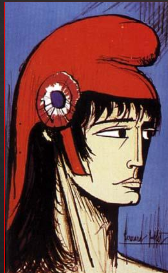
Marianne , par Bernard BUFFET