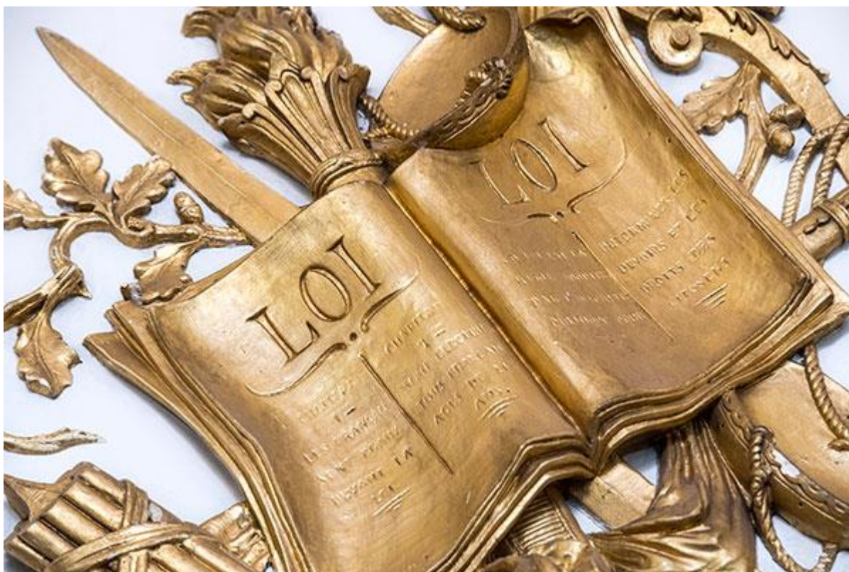
Représentation des tables de la Loi dans le salon des oiseaux de l'hôtel de Bourvallais

http://www.justice.gouv.fr/histoire-et-patrimoine-10050/les-symboles-de-la-justice-21974.html