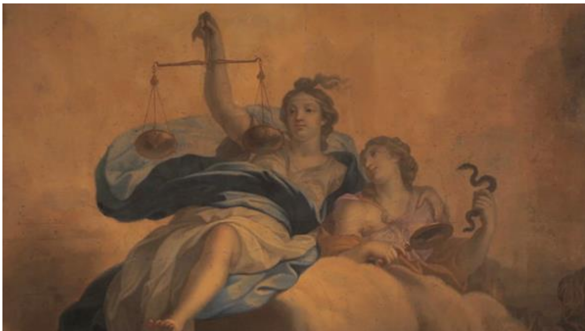
Détail d'un plafond du parlement de Bourgogne, siège de la Cour d'appel de Dijon

http://www.justice.gouv.fr/histoire-et-patrimoine-10050/les-symboles-de-la-justice-21974.html