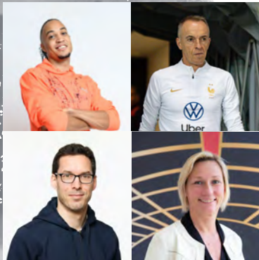
Table ronde : comment organiser les conditions de la Haute-Performance ?

Lors de cette table ronde, différents spécialistes du Haut-Niveau évoqueront les conditions de l'optimisation de la performance lors des étapes qui jalonnent la course à la médaille. Association fine des intervenants, planification, organisation des temps de l'athlète... C'est par la mise en synergie de ces différents acteurs du Haut-Niveau que l'athlète construira son parcours vers les Jeux.