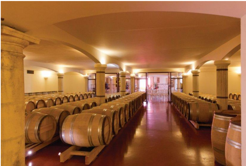
Chai à Barrique.