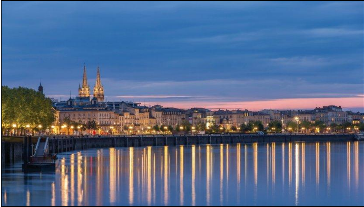
Panorama des quais de Bordeaux