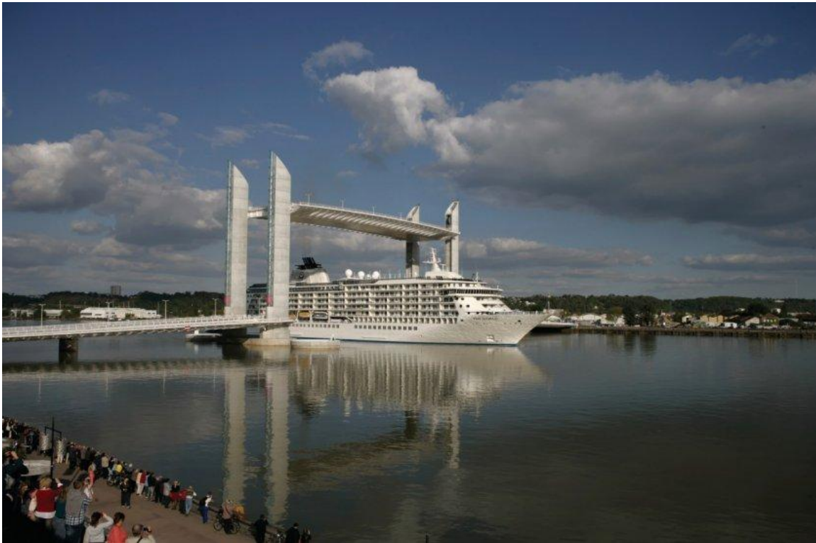
Pont Chaban Delmas