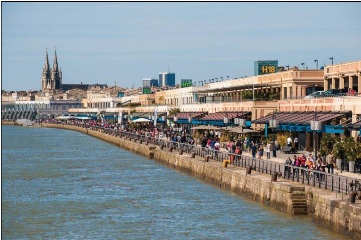
Le marché des Chartrons

http://leschroniquesdeloenotourisme.com/