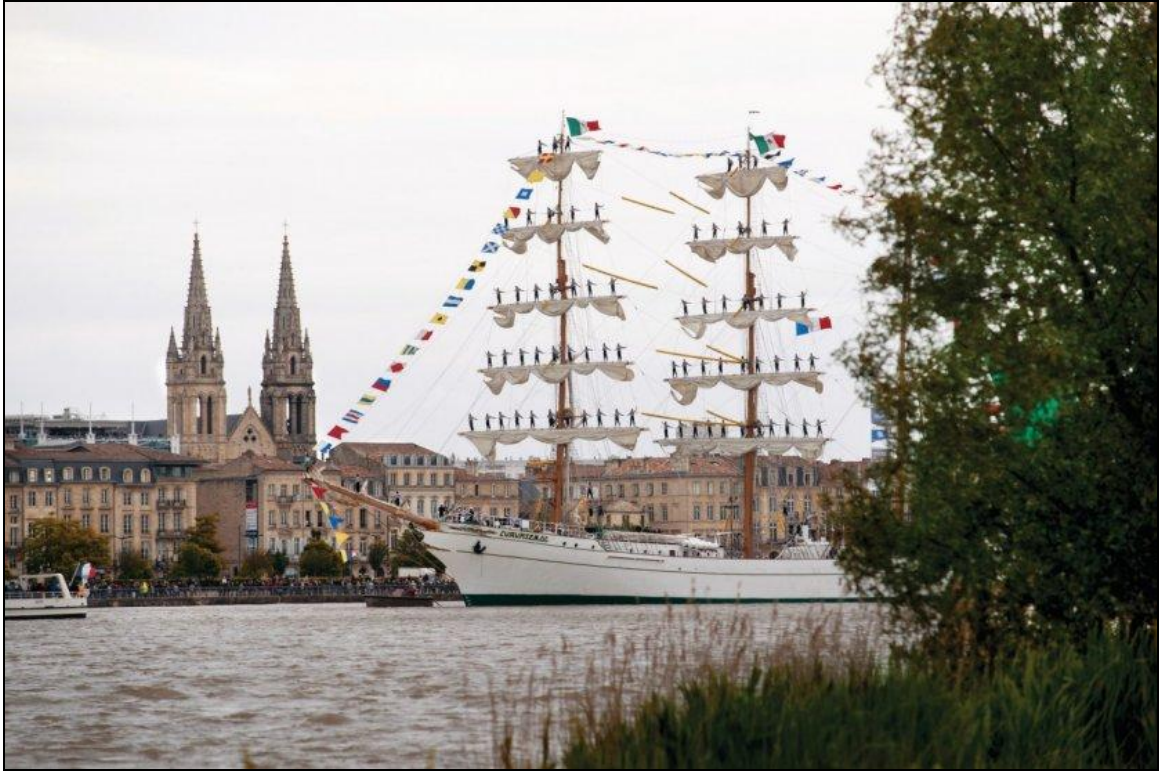
Fête du fleuve.