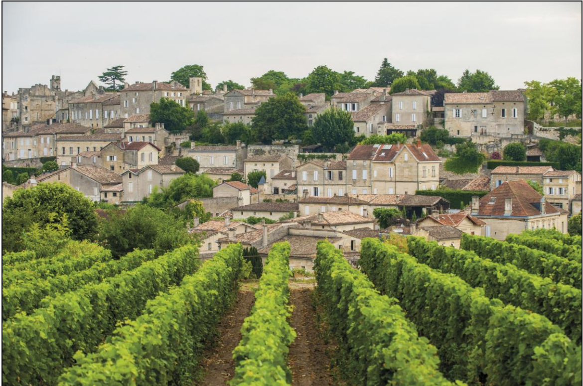
Jurisdiction de Saint-Émilion

http://leschroniquesdeloenotourisme.com/