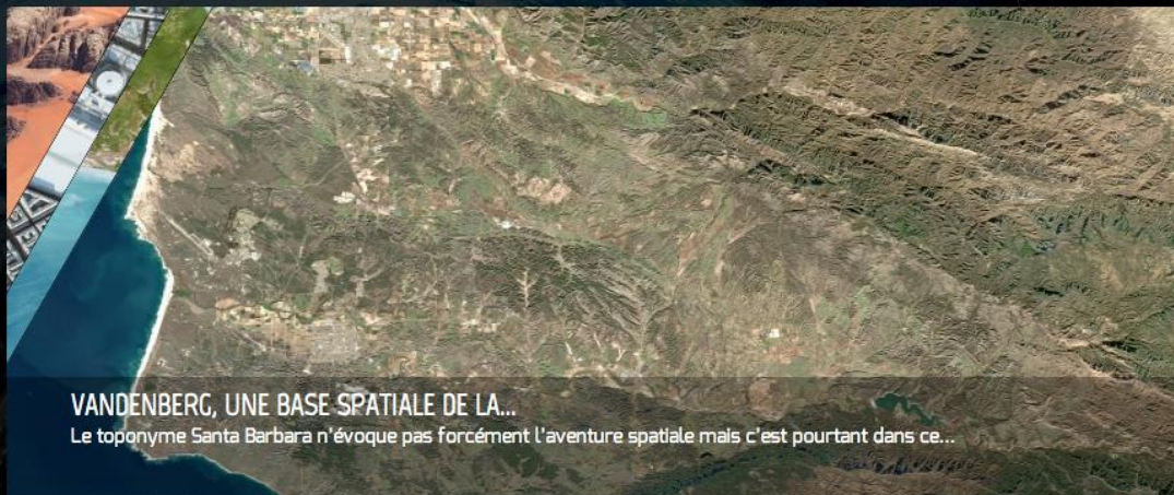
VANDENBERG, UNE BASE SPATIALE DE LA... Le toponyme Santa Barbara n'évoque pas forcément l'aventure spatiale mais c'est pourtant dans ce...