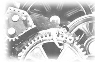
Les Temps modernes, Charles Chaplin, 1936.