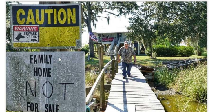
D. La mère des frères Billiot n'entend pas quitter sa maison qu'elle habite depuis toujours