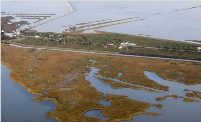
A. Une digue est construite le long d'une route menant à l'Isle de Jean Charles.

DOCUMENT 3 : photographies de l'Isle de Jean Charles