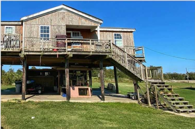
B. Maison surélevée dans les années 2000 pour éviter que ses habitants soient inondés.