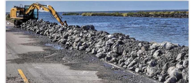
C. Une digue est construite le long d'une route menant à l'Isle de Jean Charles.