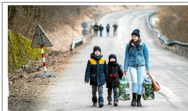
Doc 3 : une famille ukrainienne sur les routes. Le photographe Peter Lazar (AFP) a pris ce cliché le 25 février. Ce même jour, le président ukrainien avait déclaré la « mobilisation générale ».