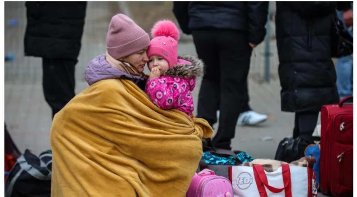
Image d'illustration dans un camp de réfugiés en Pologne.

6/ doc 4 : Quels sont les besoins immédiats des réfugiés accueillis en Pologne ?