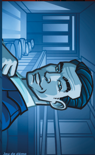
Jeu de démo