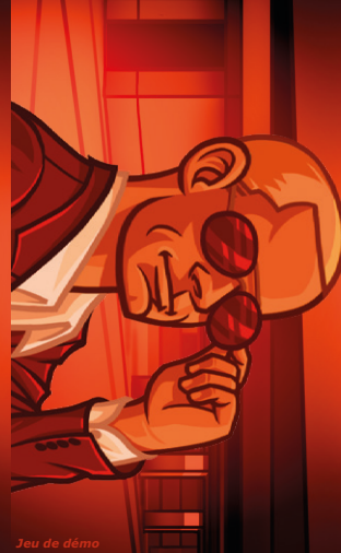
Jeu de démo