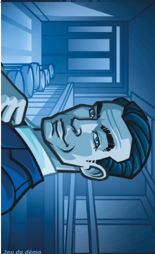
Jeu de démo