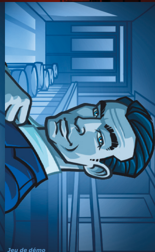
Jeu de démo