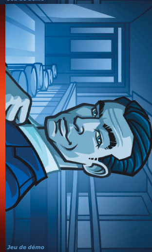
Jeu de démo