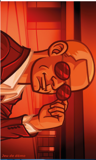
Jeu de démo