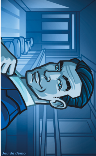
Jeu de démo