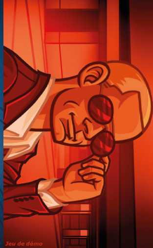
Jeu de démo