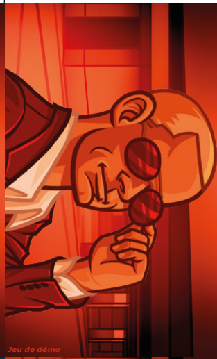
Jeu de démo