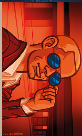
Jeu de démo