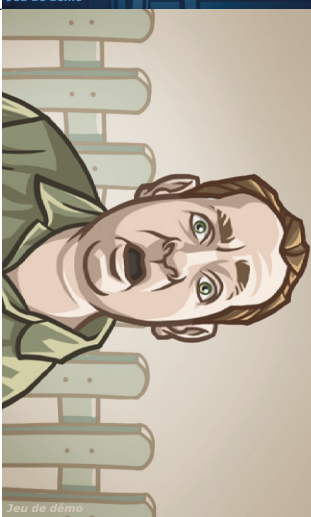
Jeu de démo