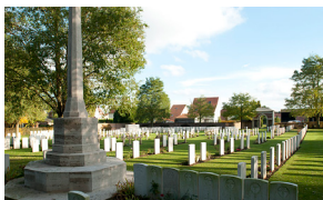
St Patrick's Cemetery