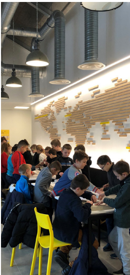
L'atelier au centre