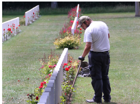
Nos équipes horticoles

La mission de la Commonwealth War Graves Commission (Commission des sépultures de guerre du Commonwealth - CWGC) est d'honorer la mémoire des hommes et des femmes tombés en service ou à la suite d'un conflit afin que leur nom vive à jamais et que le coût humain de la guerre ne soit jamais oublié.