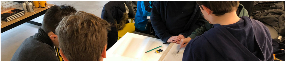
L'atelier au centre

L'atelier s'organise en trois temps. Dans un premier temps, les élèves découvrent le rôle et la mission de la CWGC et le projet du Loos British Cemetery Extension. Dans un deuxième temps, les élèves sont répartis en groupe pour concevoir leur projet de conception d'un cimetière militaire. Ils ont à disposition du matériel : feuilles A3, crayons de couleurs et feutres, lego. Dans un troisième temps, les élèves présentent leur projet aux autres. Un bilan est effectué avec les élèves.