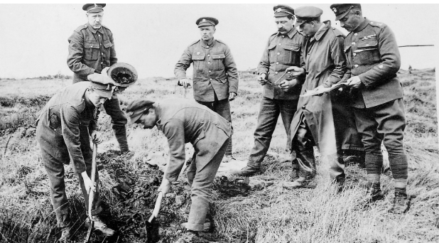
Unité d'Enregistrement des Sépultures de Guerre à la recherche de corps