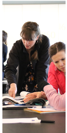
L'analyse de cas