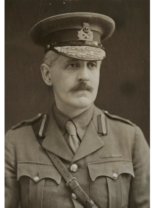
Sir Fabian Ware, notre fondateur