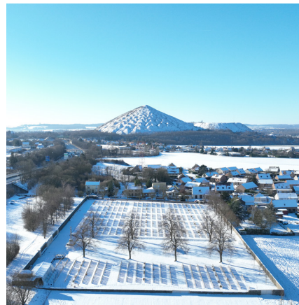
Loos British Cemetery et terrils du 11/19