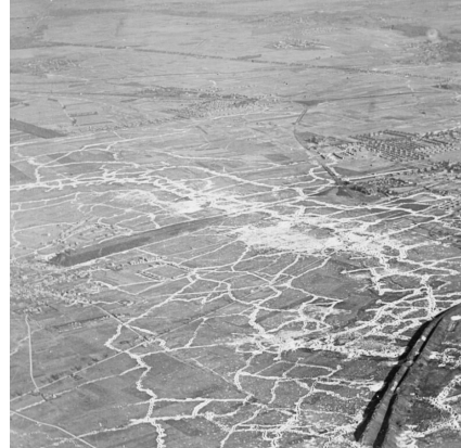
Vue aérienne de Loos (gauche), Lens et terrils jumeaux, circa 1917

Jouxant le cimetière militaire de Loos, le Loos British Cemetery Extension pourra ainsi accueillir près de 1 200 inhumations, avec une inauguration en septembre 2024.