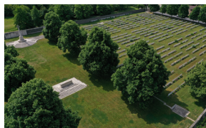
Loos British Cemetery