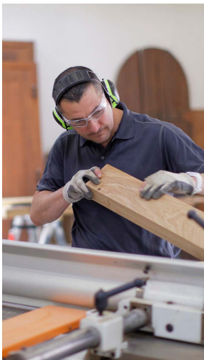
Nos ateliers d'artisanat