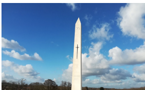
Hill 70 Memorial