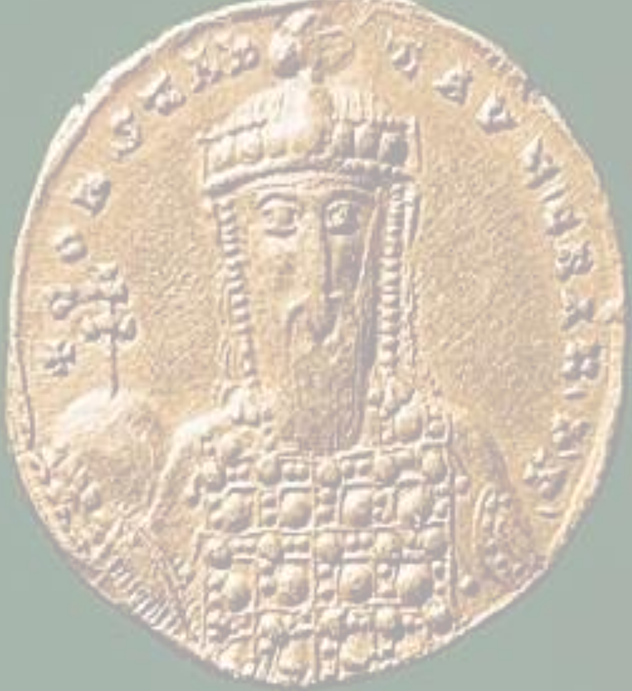
Illustration en fond : pièce de monnaie à l'effigie de l'empereur byzantin Constantin VII.