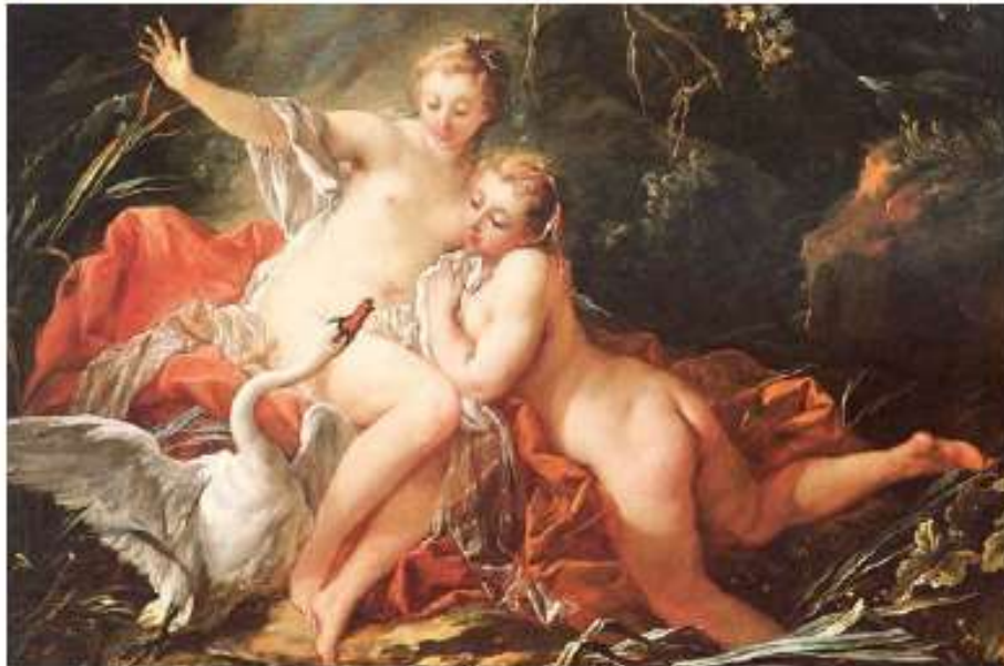
François Boucher, Léda et le Cygne , 1741

1. Observe ce premier tableau et réponds aux questions ci-dessous.