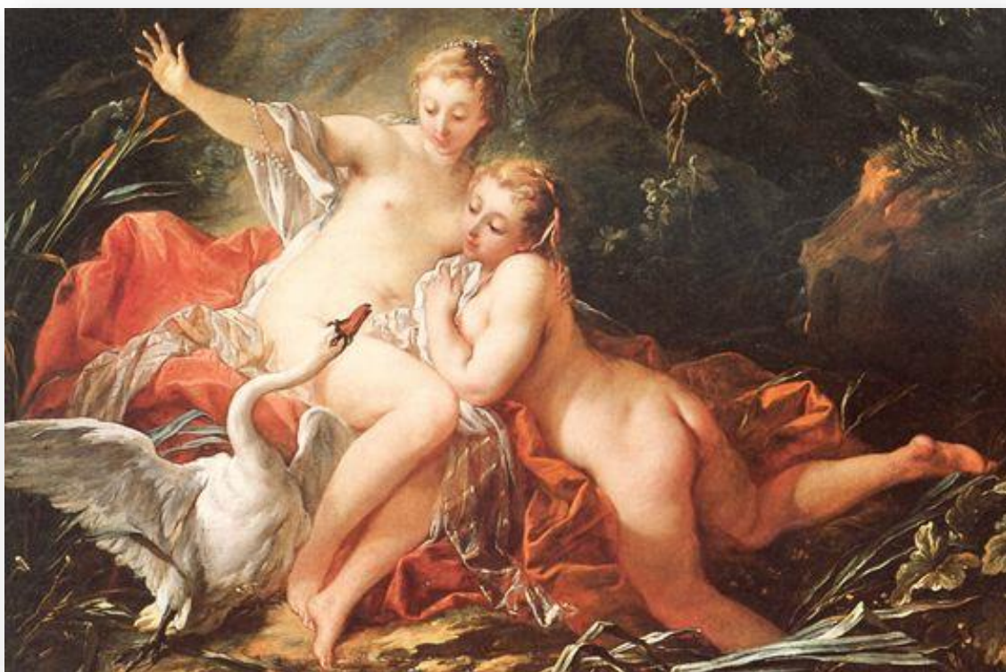
François Boucher, Léda et le Cygne , 1741

1. Observe ce premier tableau et réponds aux questions ci-dessous.