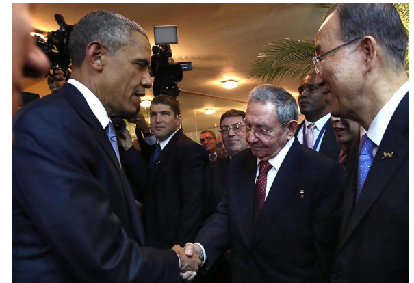
AFP Photo – Presidencia Panama 10 /04/2015

⇒ Avril 2015 : Rencontre Obama / Raul Castro : Lis l'article du journal Le Monde et explique ce qui s'est passé :