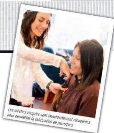
Les mèches coupées sont immédiatement récupérées pour permettre la fabrication de perruques